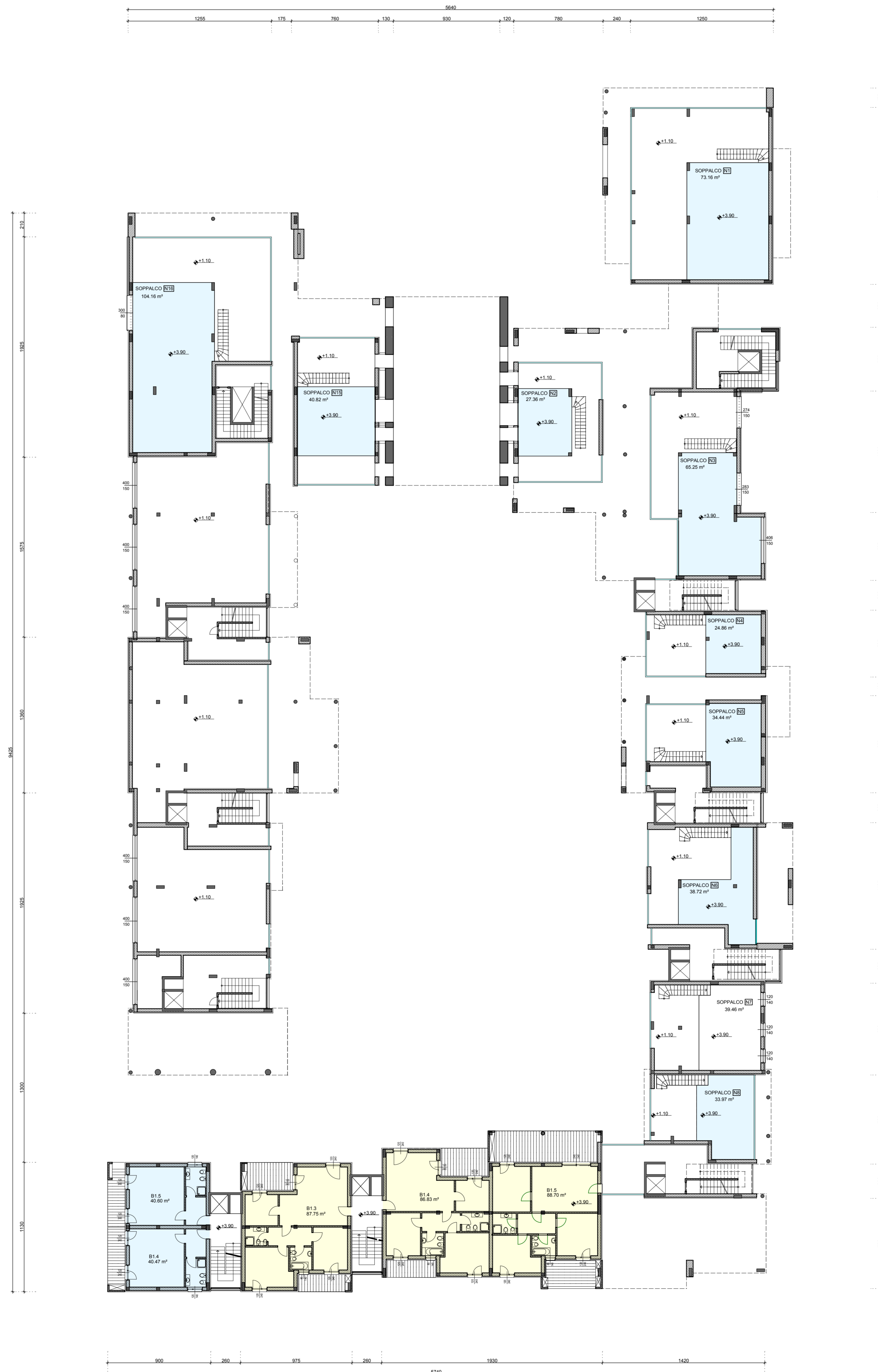
PIANTA A QUOTA + 3,90 m - SCALA 1:200