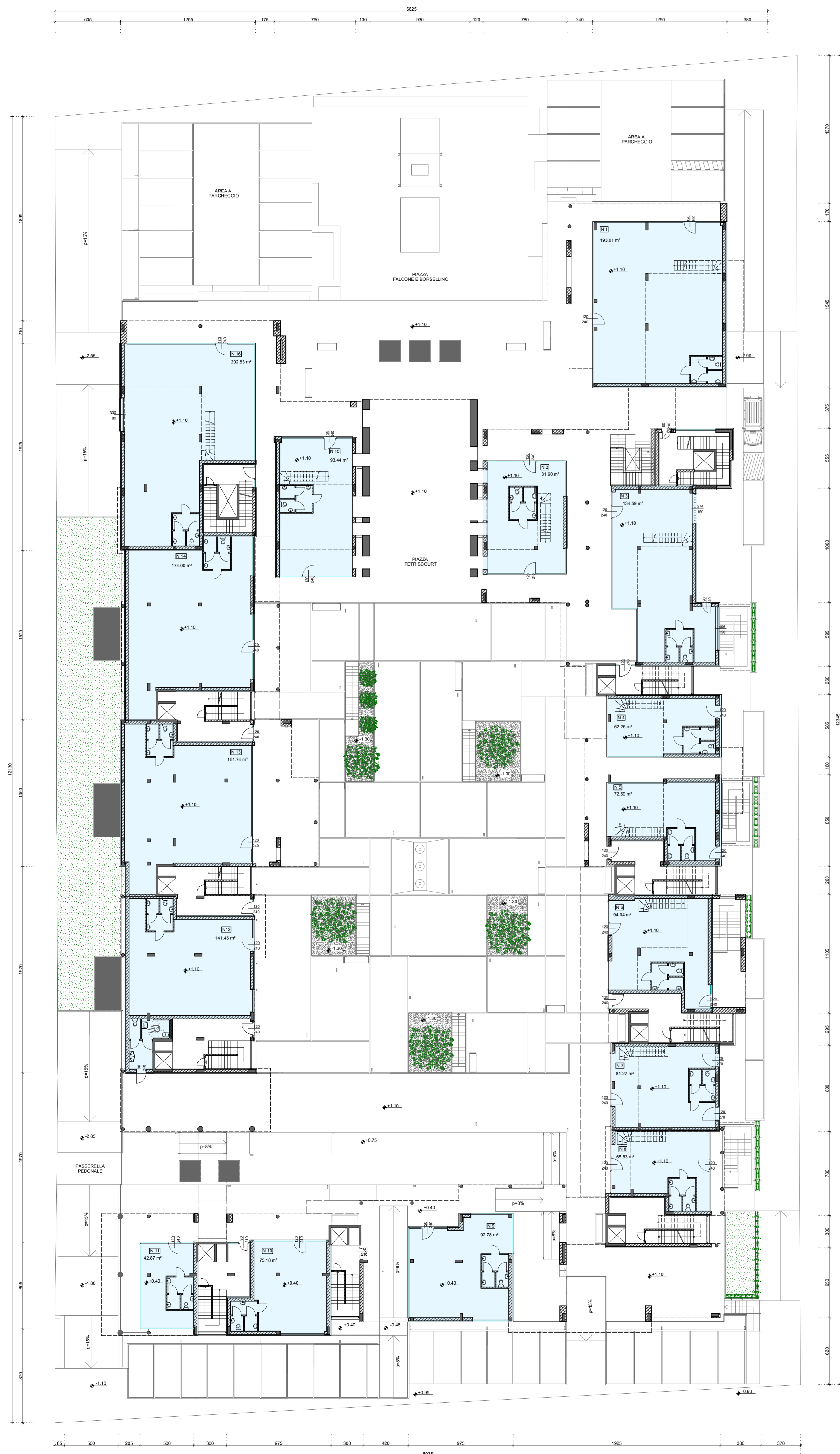
PIANTA A QUOTA + 1,10 m - SCALA 1:200