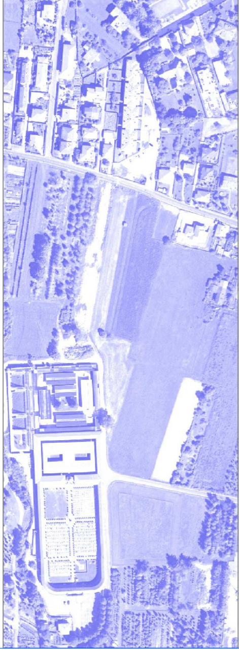
tavola: PLANIMETRIA ILLUSTRATIVA DI PROGETTO E DI VARIANTE SOVRAPPOSIZIONE DELLE AREE A SERVIZI

progetto: PIANO ESECUTIVO CONVENZIONATO IN AREE RESIDENZIALI RI E R2 - VARIANTE