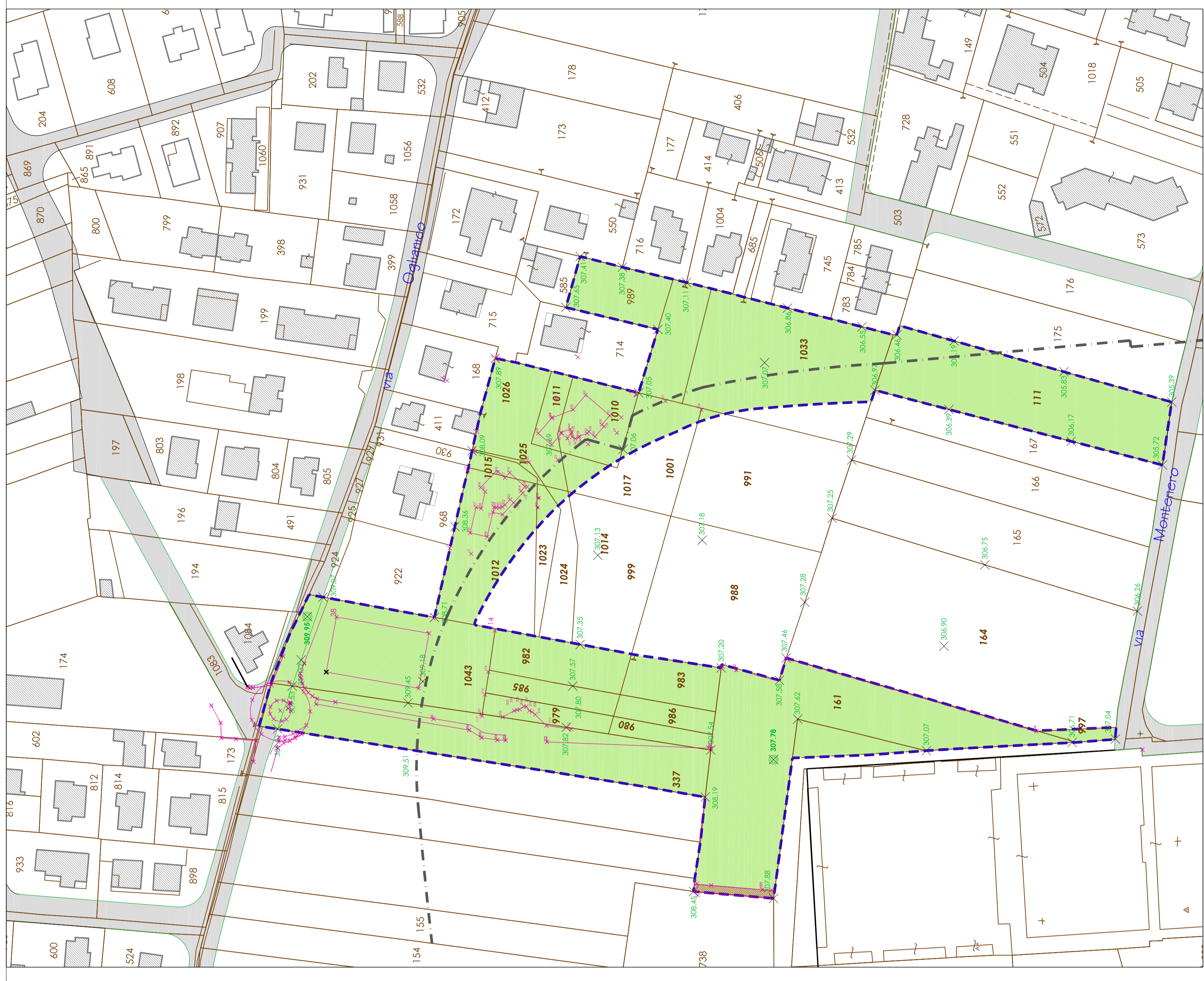
PLANIMETRIA DI RILIEVO - IN VARIANTE scala 1 : 1000