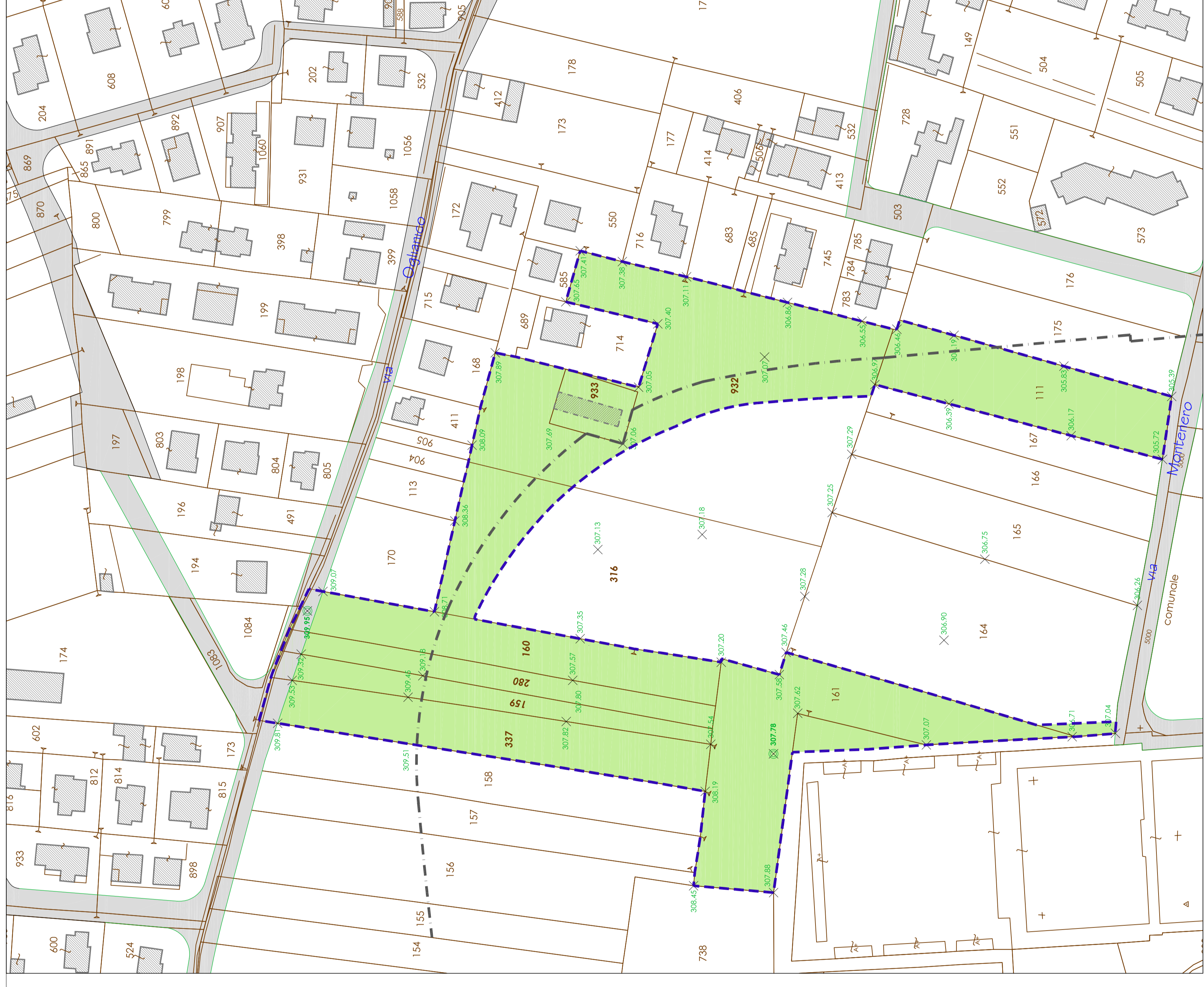
PLANIMETRIA DI RILIEVO - DI PROGETTO scala 1 : 1000