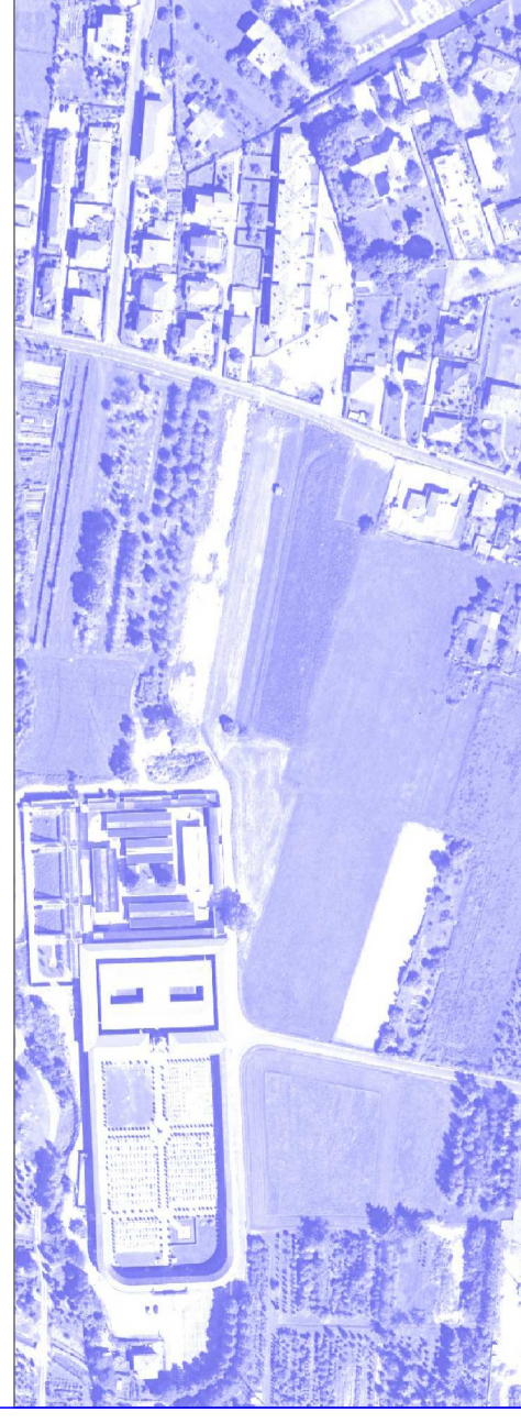
tavola: INQUADRAMENTO PLANIMETRICO DI PROGETTO E DI VARIANTE

progetto:PIANO ESECUTIVO CONVENZIONATO IN AREE RESIDENZIALI RI E R2 - VARIANTE