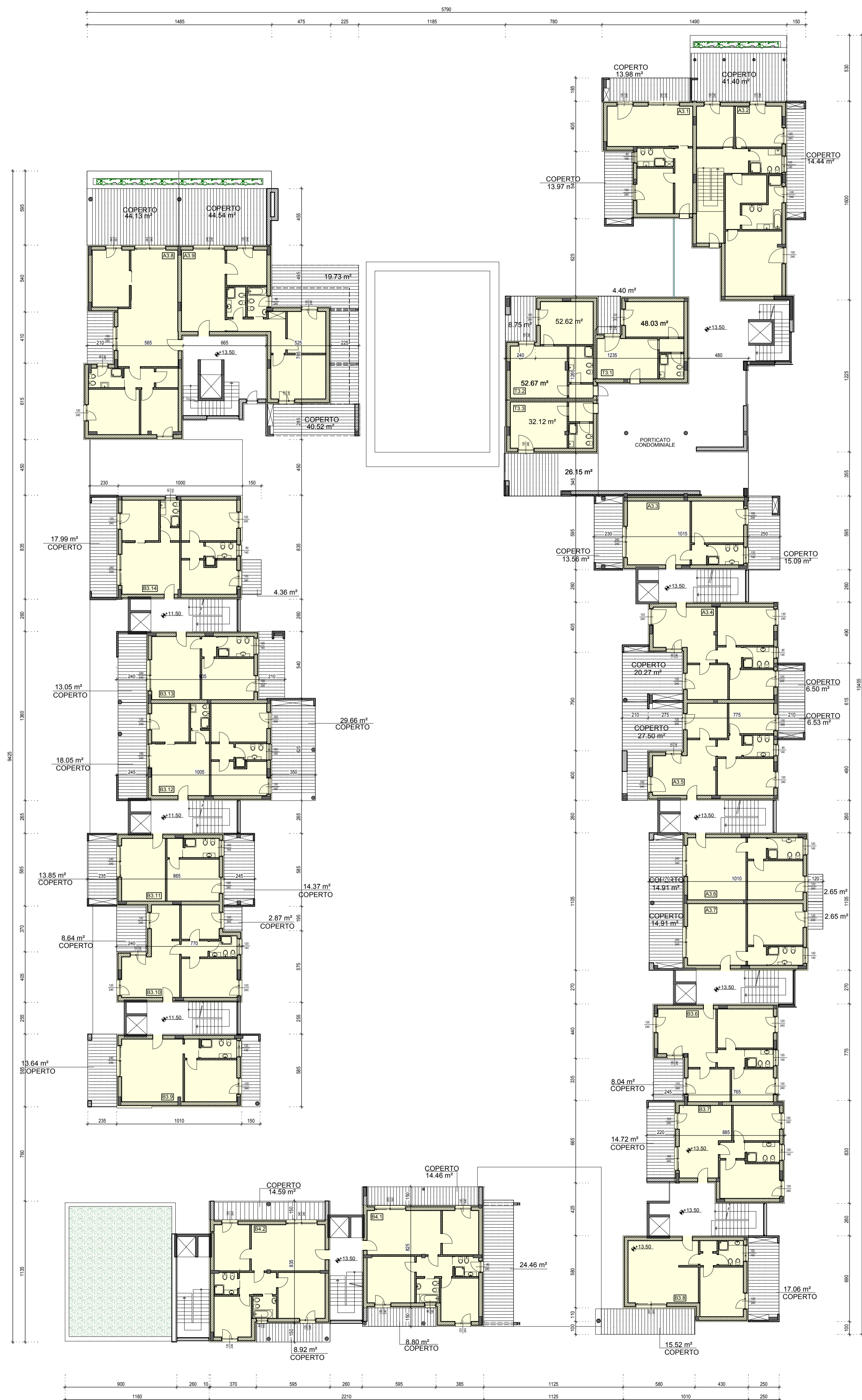
PIANTA QUOTA + 13.50 - SCALA 1:200