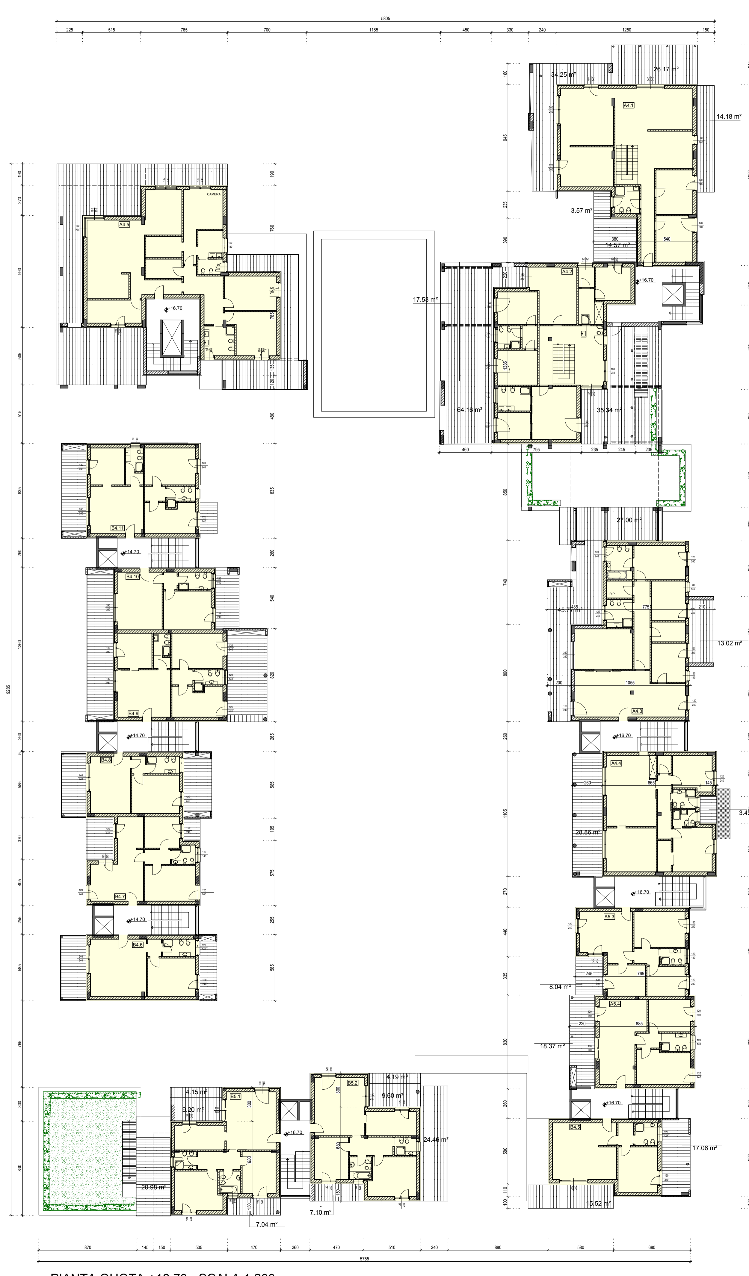
PIANTA QUOTA +16.70 - SCALA 1:200